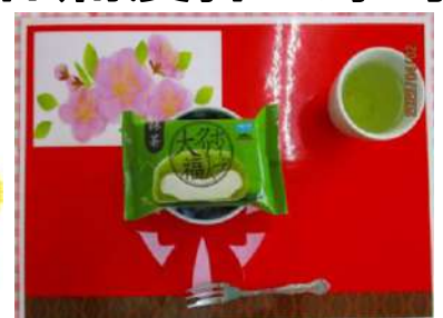
抹茶クリーム大福