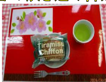
ティラミスシフォン