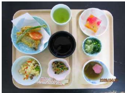
春の炊き込み御飯