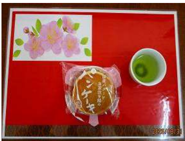
バターと餡のパンケーキ